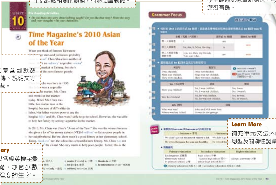
▲ 取材自初級閱讀第一冊，第42~43頁。